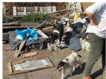
Unterschlupf für die armen Hunde | Ein improvisiertes Hundeleben | Gerümpel, aber besser auf der Straße

Eine davon, die 3-beinige Triksie , darf mitfliegen nach Österreich, eine sehr nette Familie aus NÖ hat sie mittlerweile bei sich aufgenommen und ihr ein schönes Heim ermöglicht, wo sie ihr schreckliches Vorleben vergessen kann...!