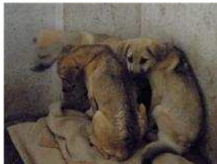
Im OP | Demodex-Hunde am Ende ihrer Kräfte | Angst und Entsetzen bei den Straßenhunden, doch das Vertrauen wächst

Gegen Ende der Woche kam Besuch aus Österreich und Deutschland. Tom von "Respektiere" und Erwin vom „Sternenhof“. Sie hatten auch ein Gastgeschenk für uns. Eine an der Tankstelle gerettete 3-beinige Hündin mit 9 Babies die sie gefunden hatten. Weiters eine trächtige und klapperdürre, ausgehungerte Hündin , die irgendwo untergebracht werden mussten. Schnell wurde ein Zwinger freigemacht, geputzt und mit warmen Decken ausgelegt und die gepeinigten Hündinnen waren für die erste Nacht untergebracht. So schön hatten sie es noch nie in deren Leben.