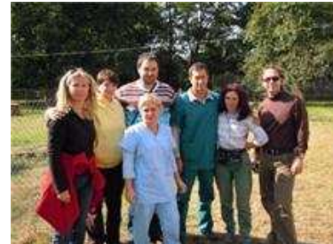
Die 3-beinige Mama mit ihren Babies | Besuch von Respektiere und Sternenhof | Hundehütten mit Spenderschild | Unser Team

Wir kastrieren in Kazanlak ganzjährig die Straßentiere, 2 x jährlich in einer großen Aktion und trotzdem gibt es immer wieder Nachwuchs. Das Hauptübel sind die privat gehaltenen weiblichen Tiere, die an Ketten leben oder auch mal